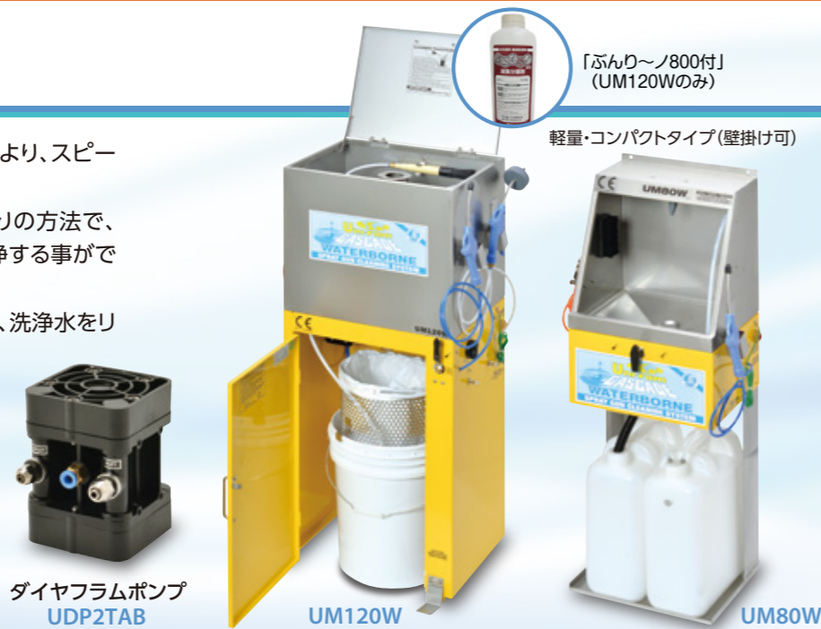
ダイヤフラムポンプ UDP2TAB