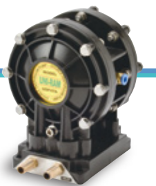
ダイヤフラムポンプ UDP4TA

高性能ダブルダイヤフラムポンプ搭載により、耐久性が大幅にアップ! 吐出量は12ℓ/分と大容量。ダイヤフラムポンプが特殊テフロン板を使用の為、溶剤系・水系塗料に対応可能です。故障の少ないメカニカルタイマーを採用し、洗浄タイマーを廻すだけの簡単作業。安全フタが付いていますので洗浄中、万が一フタを開けても自動的にポンプは停止します。