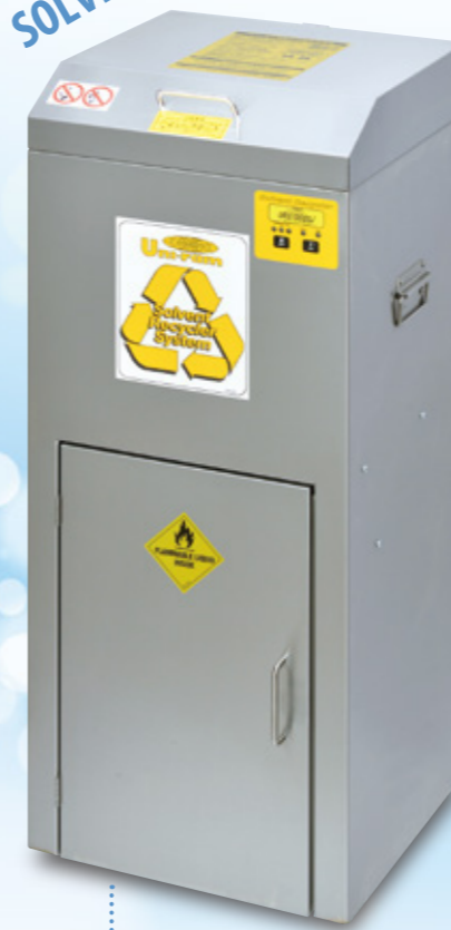
自動溶剤再生装置 URS700SSJ