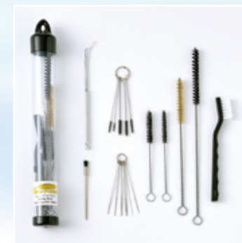
スプレーガン・クリーニングキット (オプション) KIT-GCTOOLS

高性能ダイヤフラムポンプ搭載により、スピーディな洗浄が可能。 洗浄ガンと洗浄ブラシによる2通りの方法で、素早くガンやカップ等を綺麗に洗浄する事ができます。 洗浄後の汚水を塗料と水に分離し、洗浄水をリサイクルできます。