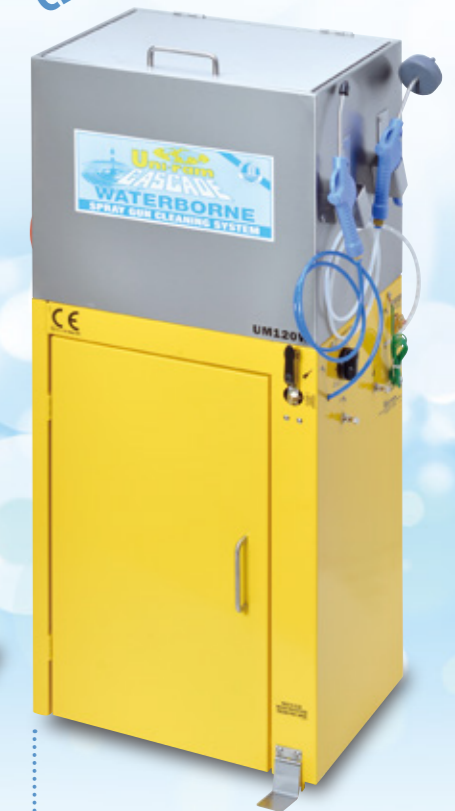
水性塗料用スプレーガン洗浄機 UM120W

MANUAL SPRAY GUN CLEANER WATER BORNE PAINTS