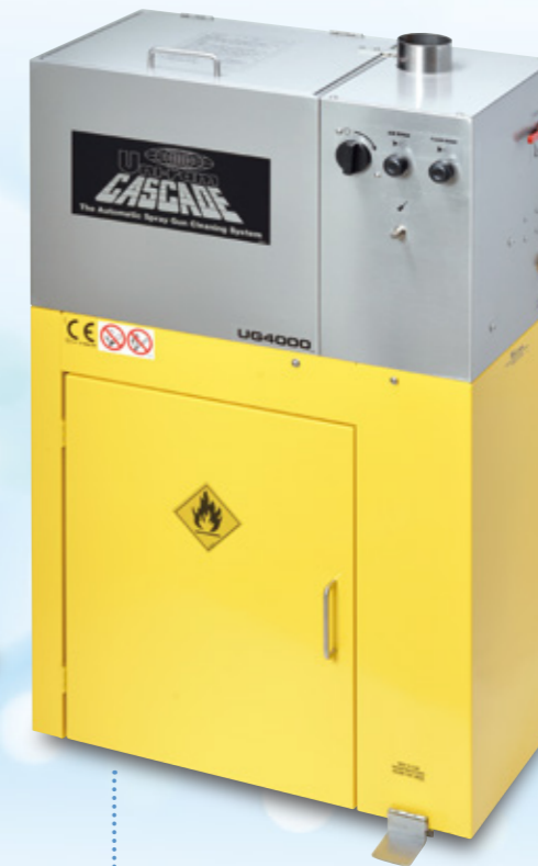
自動スプレーガン洗浄機 UG4000VM

MANUAL SPRAY GUN CLEANER WATER BORNE PAINTS