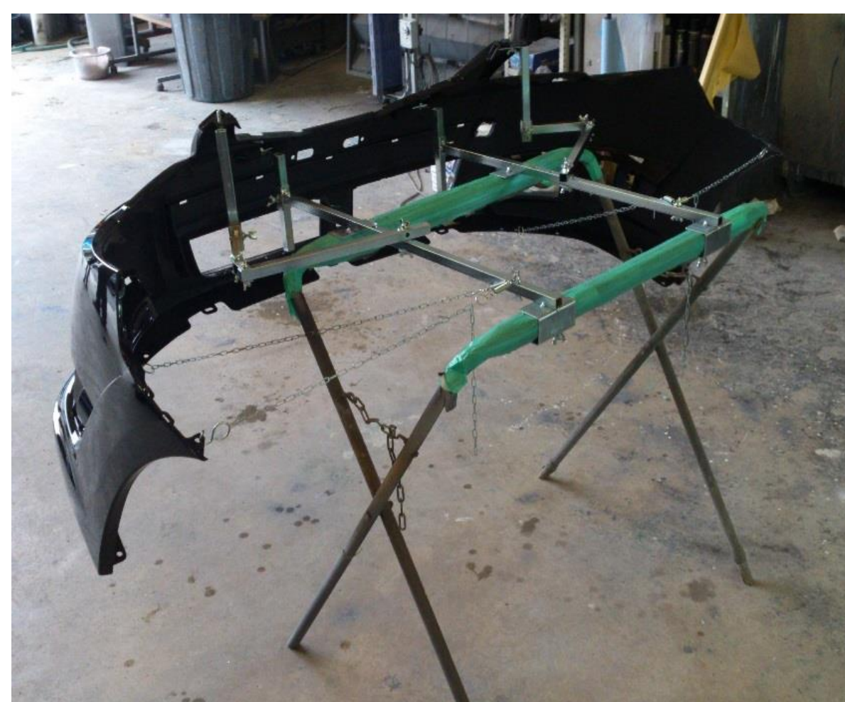
リヤバンパー装着例