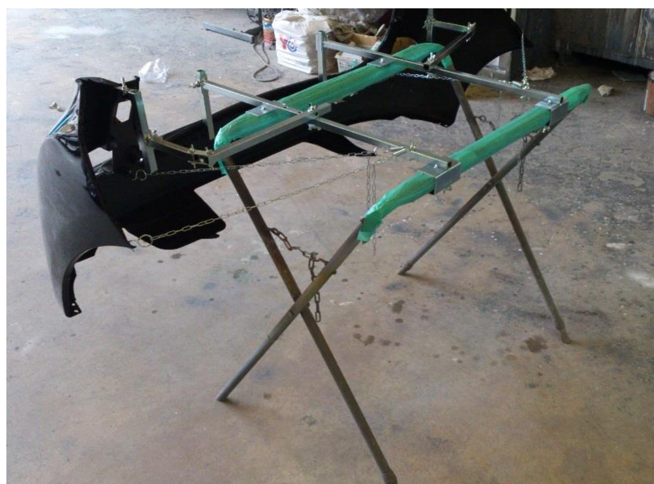
フロントバンパー装着例