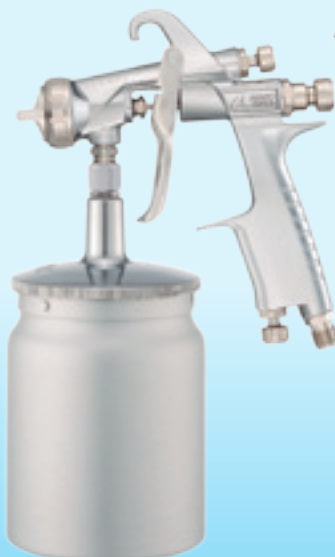
WIDER1-15H2S 吸上式 PC-2 コンテナ取付例