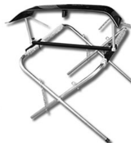
スポイラーの固定