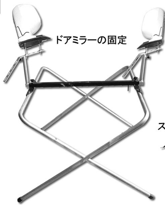
ドアミラーの固定