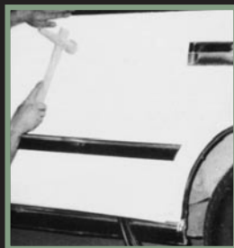
叩き出し修正(ツボ出し)