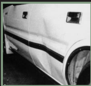
乗用車(ドア部分例)