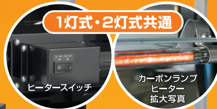
ヒータースイッチ