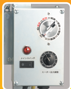
2灯式コントローラー