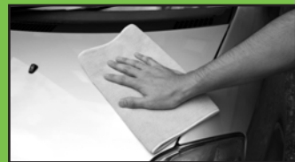
コーティングの時のウエスとしても