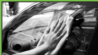
窓ガラスを拭いてもきれいに

やわらかくふわふわと感じるクロスは毛足が長くデリケートなメタリック車や黒パールの塗膜を拭き上げる際、キズが入りにくい構造となっています。超極細繊維で水拭きや乾拭きだけで簡単に汚れがとれるクロスです。