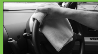
ハンドルに付いた手垢の拭き取りも