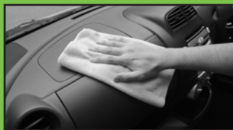
ダッシュボード等の樹脂の拭き取りも