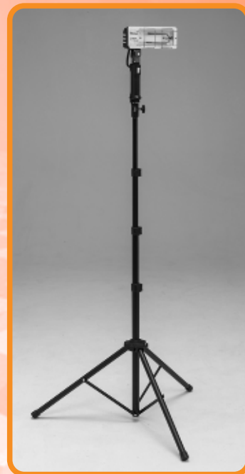
スタンド取付け例

溶剤系塗料は元より水系塗料の乾燥には欠かすことの出来ない「カーボンファイバーヒート効果(近赤+遠赤効果)」をコンパクトに設計し、ハンドタイプに仕上げた優れものです。