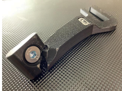
◆取り付けのまま落下したことで発生した破損の例。

• ポリッシャーへの取り付けは、 安定した場所にポリッシャーを置いた状態で行ってください。 取り付け方法などは、この後に記載させていただきますが、手順にボルトを締める作業が発生します。必ず落下の可能性が無い場所で行ってください。